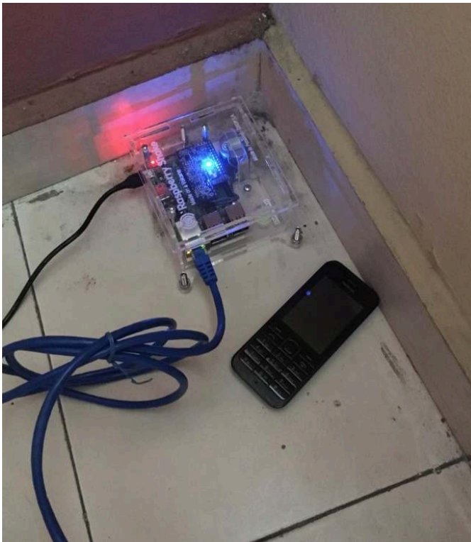
Figure 1 - Photo d'un sismomètre Raspberry Shake, installé chez un hébergeur à Port-au-Prince. Le téléphone portable donne l'échelle.